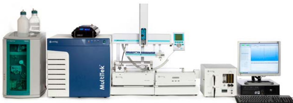
Aparat w pełnej konfiguracji z podajnikiem i przystawką do LPG

MultiTek™ umożliwia badanie próbek stałych, cieczy, próbek gazowych oraz skroplonego gazu (LPG) zapewniając detekcję na poziomie lepszym niż systemy konkurencyjne.